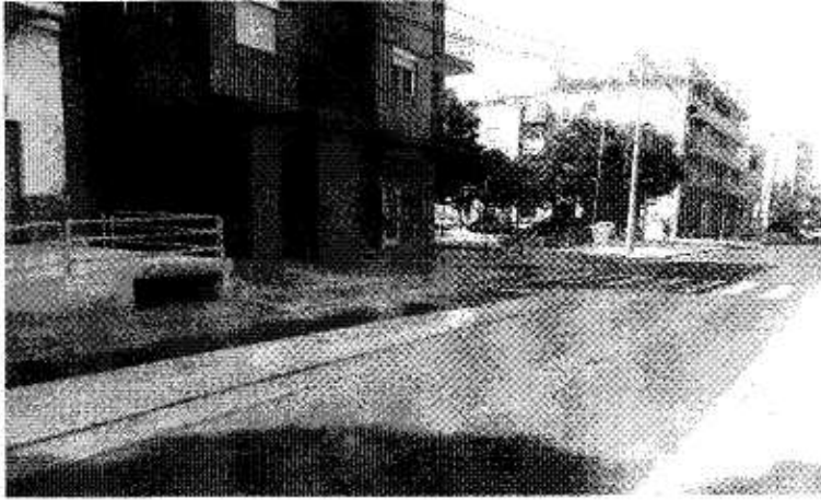
Fig. 2. Desembocadura de la rambla que discurre por la C/ Olivos hasta la C/ Mayor