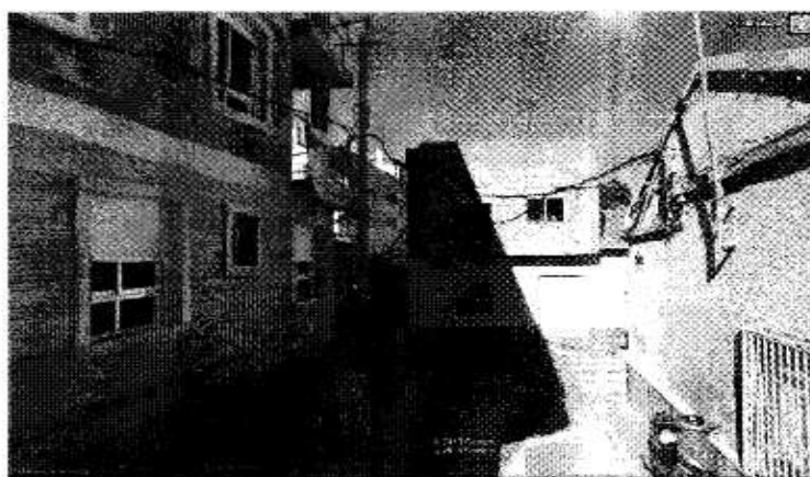
Fig. 1.: Vivienda en la calle Salzillo perpendicular a la calle Olivos, donde se puede observar la rejilla que sirve de entrada del agua de escorrentía.

De forma bastante sorprendente se autorizó que las aguas pudieran discurrir por una canalización que discurre por el semisótano de una serie de viviendas particulares hasta desembocar por debajo de otra vivienda en la Calle Mayor nº 13, o lo que es lo mismo en la RM-302.